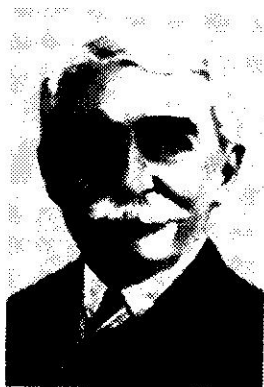
П. де Кубертен.