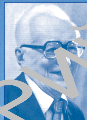
Петр Яковлевич ГАЛЬПЕРИН