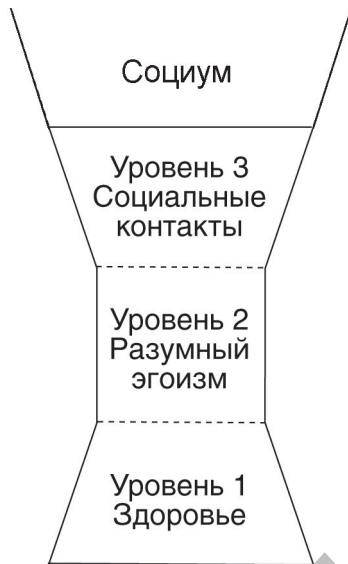
Рис. 2. ЛОКС. «Счастье №2»

Конечно, ЛОКС не имеет никаких противоречий и с концепцией А. Уотермана (Waterman A.S.), описывающей