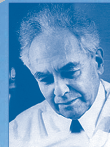
Александр Романович ЛУРИЯ

НАЦИОНАЛЬНЫЙ ПСИХОЛОГИЧЕСКИЙ ЖУРНАЛ № 2 (8) 2012