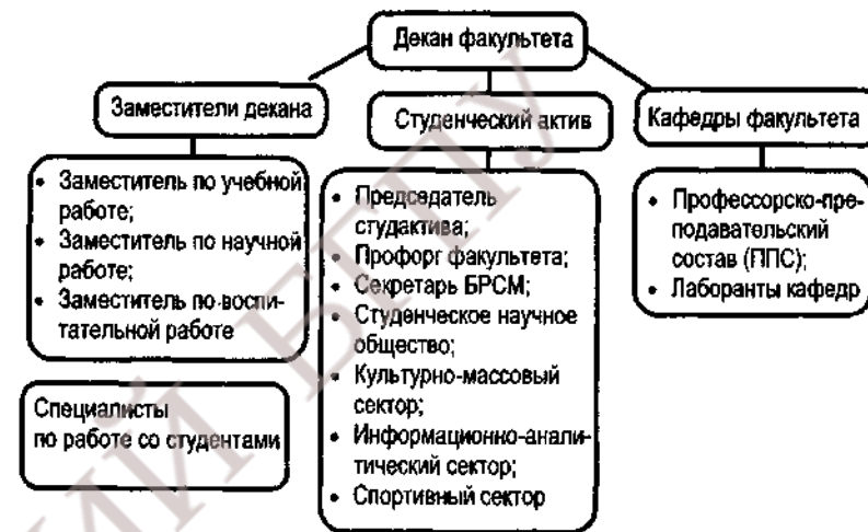
Рисунок 2 – Структура факультета

подготовки специалистов. Непосредственное руководство факультетом осуществляет его декан. В состав факультета входят кафедры (рисунок 2).