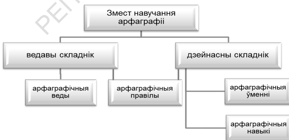
Малюнак 1. – Структура зместу навучання арфаграфіі

Дзейнасны складнік зместу навучання арфаграфіі ўтвараюць арфаграфічныя ёменні і навывкі (малюнак 1).