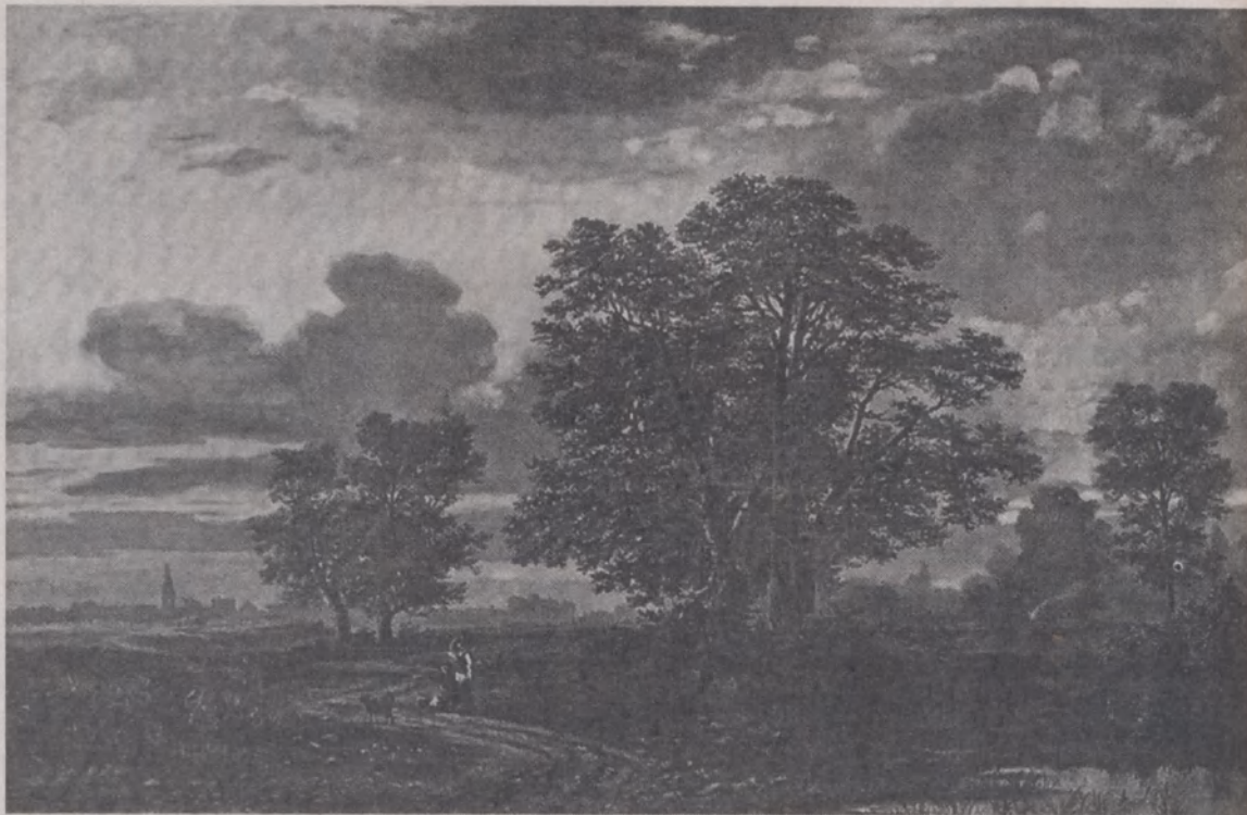
«Вечар у Мінскай губерні» (1870-я).

права прэтэндаваць на вялікі залаты медаль. У якасці праграмы мастаку зацвярджаецца пейзаж: «Від у Пскоўскай губерні». Месца для напісання «дыплама» Гараўскі выбірае невыпадковае: у гэты час сюды, у Пскоўскую губерню, перасяляецца палкоўнік Бенуа, і Апалінарыў часта да яго наведваецца.