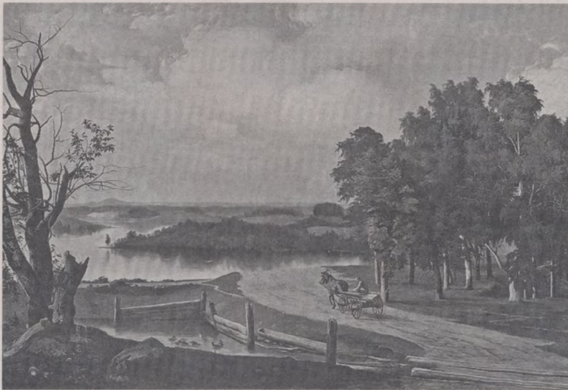
«Пейзаж з ракой і дарогай» (1853).

Знаходзячыся ў цяжкім стаіе, Апалінары Гіляравіч піша ў Пецябургскую акадэмію мастацтваў са станцыі Свіслач Бабруйскага павета: «Путешествуя с ранней весны, я занимался съёмкой этюдов с природы из русской природы и изучением коров, телят, овец и типичных фигур, чтобы соединить пейзажный род с фигурами и животными. И в июле месяце, писавши с природы весьма характерные “Пииские болота”, от сырой почвы, зелени и тамошнего воздуха незаметным образом получил лихорадку и ревматизм в правой ноге. Так что принужден был оставить начатую работу и, вылечившись, опять занялся новыми материалами, поэтому и отстал от задуманного мной дела, которое при здоровье постараясь всеми силами вознаградить. И тогда буду иметь честь и удовольствие представить Вашему превосходительству и совету Академии художеств труды свои на благоусмотрение, а в настоящее время буду заниматься до тех пор, пока холод не прогонит меня». Упарты і чэсны.