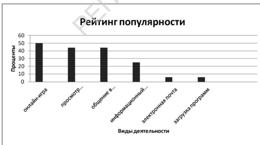
Рис. 2. Рейтинг популярности видов деятельности в Сети среди младших школьников.

В рамках занятия дети также познакомились с содержанием сайта Международного детского творческого онлайн-конкурса “Интернешка” по