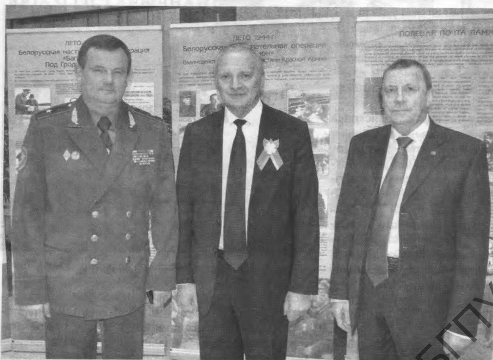
Падчас адкрыцця Міжнароднай навукова-практычнай канферэнцыі, прысвечанай 70-годдзю Перамогі ў Вялікай Айчыннай вайне і заканчэння Другой сусветнай вайны. Злева направа: міністр абароны Рэспублікі Беларусь Андрэй Аляксеевіч Раўкоў, старшыня Прэзідыума Нацыянальнай Акадэміі навук Беларусі Уладзімір Рыгоравіч Гусакоў, Аляксандр Аляксандравіч Каваленя. Фота 2015 г.

тадычных прац. У тым ліку 4 асабістыя і 20 калектыўных манаграфій, 58 вучэбных дапаможнікаў і праграм. Ён з'яўляецца навуковым рэдактарам і рэцэнзентам звыш 100 манаграфій, навуковых зборнікаў, вучэбна-метадычных дапаможнікаў, дысертацыйных прац. Ён падрыхтаваў 6 кандыдатаў навук. Ужо 11 гадоў А.А.Каваленя ўзначальвае савет па абароне доктарскіх і кандыдацкіх дысертацый у Інстытуце гісторыі НАН Беларусі. Аляксандр Аляксандравіч — навуковы рэдактар, член рэдакцыйных калегій і саветаў часопісаў "Доклады Национальной академии наук Беларуси", "Весті Нацыянальнай акадэміі навук Беларусі. Серыя гуманітарных навук", "Архівы і справаводства", "Беларуская думка", "Беларускі гістарычны часопіс", "Гісторыя і грамадазнаўства", "Историческое пространство. Проблемы истории стран СНГ". Ён ўзначальвае Камісію Нацыянальнай акадэміі навук Беларусі па гісторыі навукі і секцыю "Гуманітарныя і грамадскія навукі" дзяржаўнага экспертнага савета "Сацыяльна-эканамічныя, гуманітарныя і грамадскія навукі" пры Дзяржаўным камітэце па навуцы і тэхналогіях Рэспублікі Беларусь, уваходзіць у склад бюро навуковага савета Беларускага фонду фундаментальных даследаванняў.