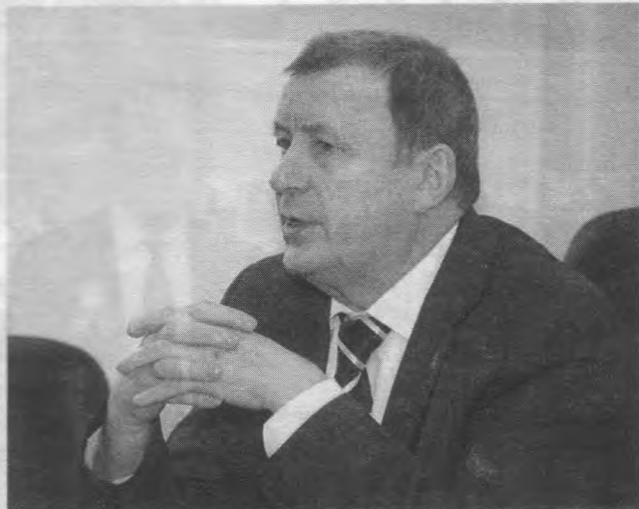
Аляксандр Аляксандравіч Каваленя падчас рабачай сустрэчы. Фота 2015 г.

Час дырэктарства Аляксандра Аляксандравіча ў Інстытуце гісторыі (2004—2010 гг.) яшчэ раз ясна паказаў яго арганізацыйныя здольнасці. Дзякуючы яго ўмеламу кіраўніцтву Інстытут гісторыі ператварыўся ў дзяржаўны цэнтр арганізацыі сістэмных гістарычных даследаванняў; вучоныя інстытута паспяхова выканалі дзяржаўную комплексную праграму навуковых даследаванняў на 2006—2010 гг. "Гісторыя беларускай нацыі, дзяржаўнасці і культуры"; 1 лістапада 2007 г. у інстытуце была адкрыта ўнікальная Археалагічная навукова-музейная экспазіцыя; вучонымі