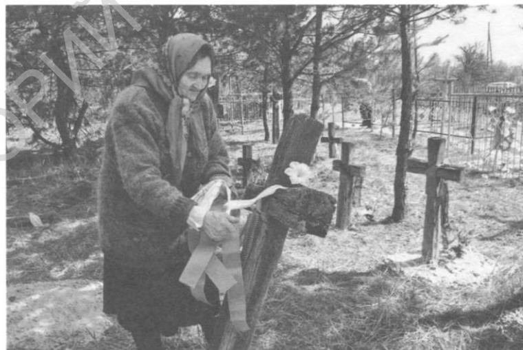
Перад Радаўніцай на могілках у в. Дронькі Хойніцкага раёна. 2004.