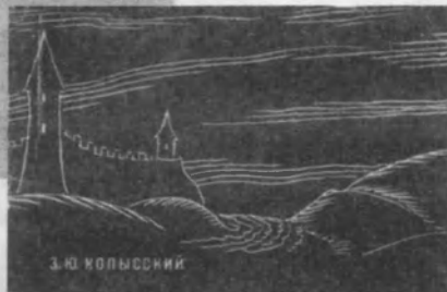
СОЦИАЛЬНО-ПОЛИТИЧЕСКОЕ РАЗВИТИЕ ГОРОДОВ БЕЛОРУССИИ В XVI—ПЕРВОЙ ПОЛОВИНЕ XVII В.