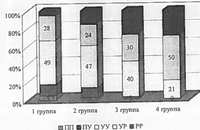
Рис.2. Распределение типов общего мотивационного профиля в группах с различной успеваемостью. УУ - полностью уплощенный тип профиля; РР - полностью регрессивный тип профиля; ПП - полностью прогрессивный тип профиля; УП - уплощенный в одной, прогрессивный в другой сфере тип профиля; УР - уплощенный в одной, регрессивный в другой сфере тип профиля.

Остановимся на результатах, показывающих характер взаимосвязи мотивационного профиля личности с учебной успеваемостью. Необходимо отметить, что успешность обучения зависит от многих аспектов психической активности субъекта. Мотивационная составляющая деятельности является одним из факторов, определяющих учебную успеваемость. Полученные в ходе исследования данные указывают на то, что «прогрессивный» тип общего мотивационного профиля обнаруживает выраженную связь со школьной успеваемостью (рис 2).