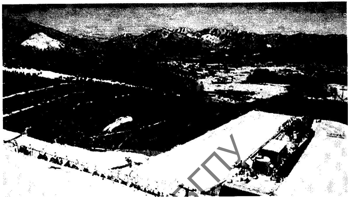
К ст. Восемнадцатые зимние Олимпийские игры. Вид на спортивную арену Игр; зажжение олимпийского огня на церемонии открытия Игр (справа).