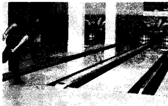
К ст. Боулинг. В Минском боулинг-клубе (слева внизу); игрок во время броска.