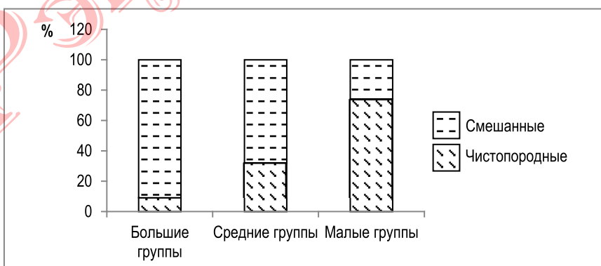
Рисунок 2 – Породная структура ландшафтных элементов сквера И. Пулихова