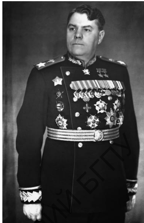
◀ Маршал Советского Союза А.М. Василевский

В ряде публикаций о А.М. Василевском ничего не говорится о его службе в рядах Красной армии в годы Гражданской войны. Попробуем восполнить этот пробел. В апреле 1919 года будущий маршал был призван на службу в РККА Новосильским уездным военкоматом Тульской губернии и направлен в 4-й запасной батальон, который дислоцировался в городе Ефремове. Служба началась в мае 1919 года: он был помощником командира взвода, командиром воинского отряда в количестве 100 человек из состава 4-го запасного батальона, командиром одной из рот 2-й Тульской стрелковой дивизии, командиром 3-го батальона этой дивизии, командиром 5-го стрелкового полка 2-й Тульской стрелковой дивизии, командиром 427-го полка 143-й стрелковой бригады 48-й стрелковой дивизии, помощником командира 96-го полка 32-й бригады 11-й Петроградской стрелковой дивизии, затем – вновь командиром 427-го стрелкового полка 48-й дивизии, помощником командира 429-го стрелкового полка 143-й стрелковой бригады 48-й дивизии 4-й армии, командиром отдельного батальона 48-й дивизии, помощником командира 424-го полка 142-й стрелковой бригады, начальником штаба 142-й бригады.