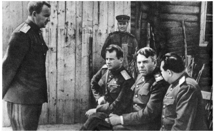
▲ Военачальники Т.Т. Хрюкин, И.Д. Черняховский, А.М. Василевский, В.Е. Макаров на командном пункте 3-го Белорусского фронта (слева направо). Лето 1944 года

А.М. Василевский в годы войны почти постоянно находился на фронтах в роли